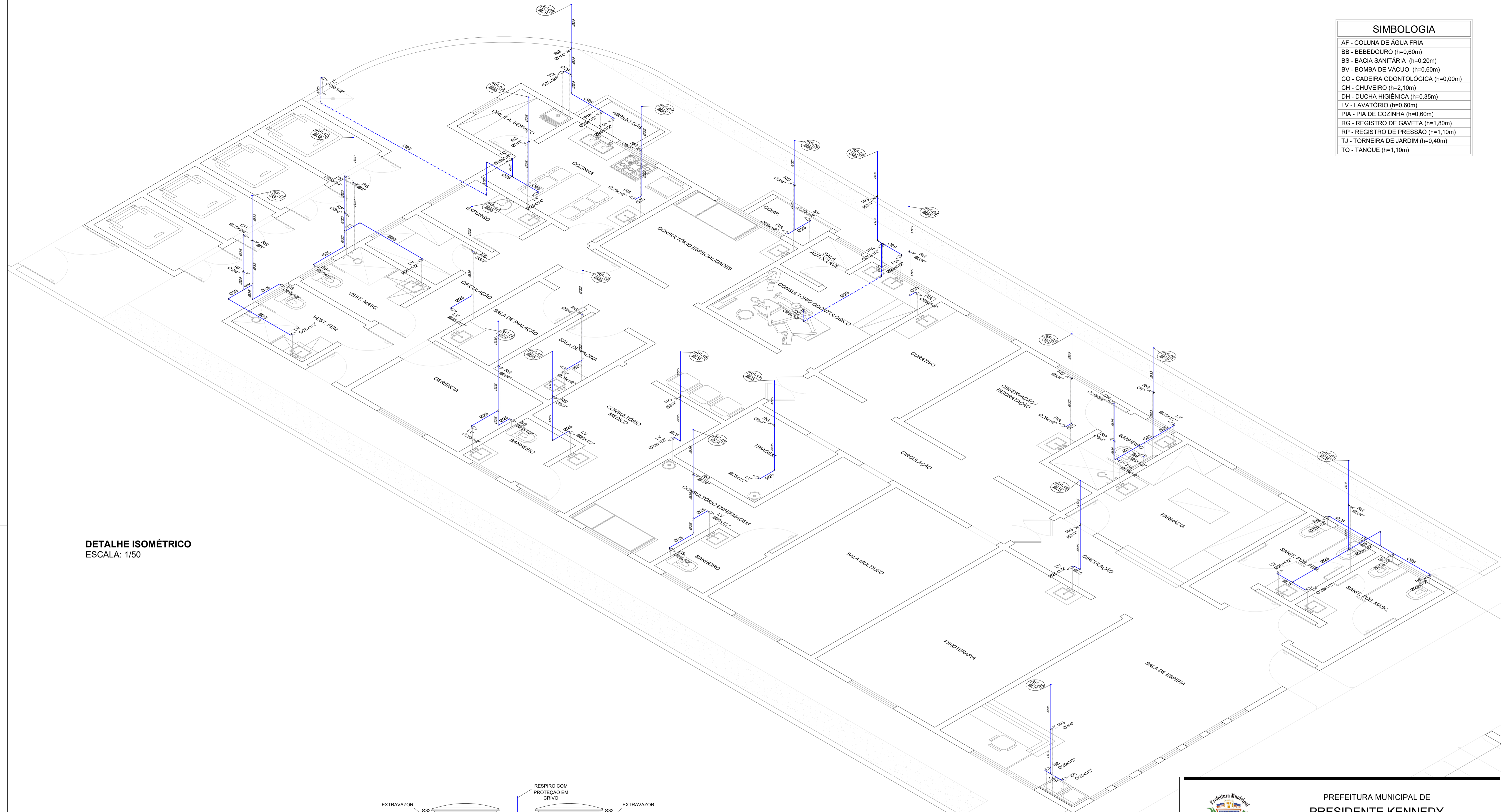
DETALHE ISOMÉTRICO ESCALA: 1/50